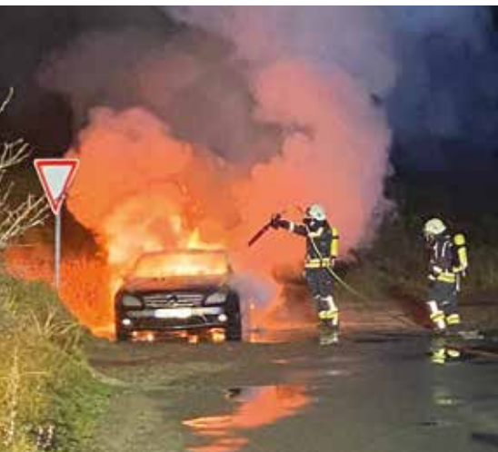
Vollbrand eines geparkten PKWs in der Blidselbucht

Trotz höchsten Ausbildungsstandards gibt es aber auch Situationen, die nur durch die Vernetzung mit weiteren Rettungskräften der Insel lösbar sind. Annika und Felix erklären, dass jeder Einsatz durch die Rettungsleitstelle Nord koordiniert wird. Hier gehen auch die Notrufe der Polizei 110 und Feuerwehr 112 ein, so dass jede Rettungsmaßnahme schnellstmöglich analysiert, geplant und durchgeführt wird und alle nötigen Hilfsorganisationen auch vor Ort sind. Darüber hinaus gibt es aber zusätzlich noch eine sehr gute insulare Vernetzung der Feuerwehren und Rettungseinheiten, wenn spontane und schnelle Entscheidungen getroffen werden müssen. Dazu gehört auch eine engste Abstimmung der Lister Feuerwehr mit der Gemeinde und deren Bauhof, was beispielsweise bei Orkan und der notwendigen Beseitigung von Schäden und sturmbedingten Hindernissen notwendig ist. Für Sylt besteht zwar ein insulares Konzept, um auf Starkwinde und deren Folgen vorbereitet zu sein. Aber schon die schnelle Abstimmung und gegenseitige Hilfe der Hilfskräfte innerhalb des Ortes helfen Gefahrensituationen zu lösen. Damit kommen Menschen oftmals gar nicht in die Lage, die eine Hilfe und Rettung nötig machen, unterstreichen Annika und Felix.