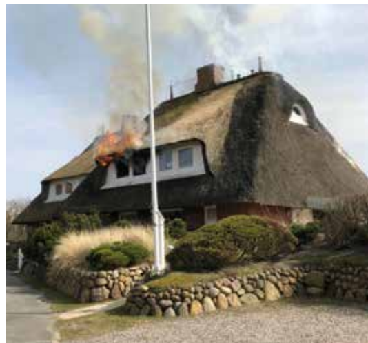
Entstehungsbrand eines Reetdachhaus im Mellhorn