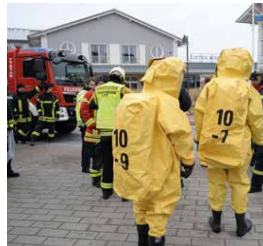
Gefahrguteinsatz aufgrund überhitzter Notstrombatterien