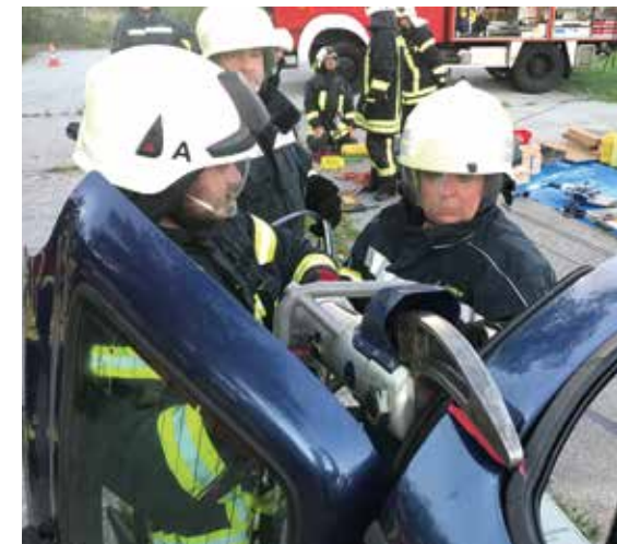
Rettung einer Person aus einem verunfallten Fahrzeug mittels schwerem Technischen Gerät